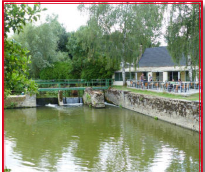
La terrasse de l'Auberge