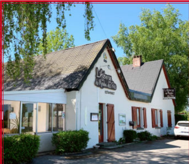
L'Auberge du Moulin des Prés