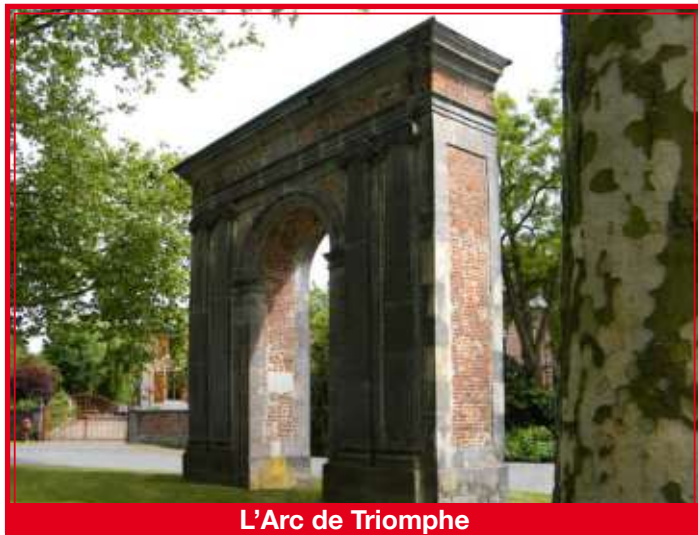
L'Arc de Triomphe