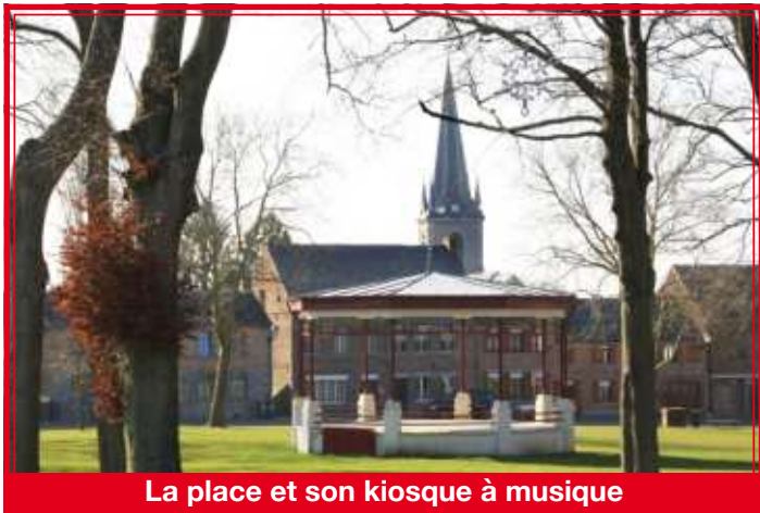
La place et son kiosque à musique