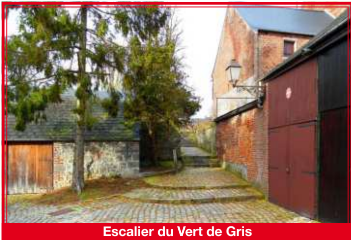
Escalier du Vert de Gris