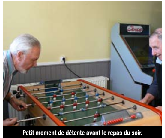
Petit moment de détente avant le repas du soir.