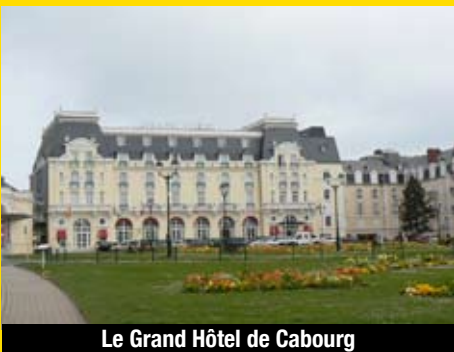
Le Grand Hôtel de Cabourg