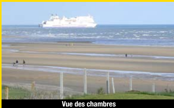
Vue des chambres