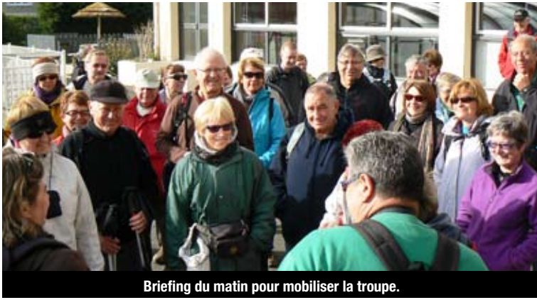
Briefing du matin pour mobiliser la troupe.