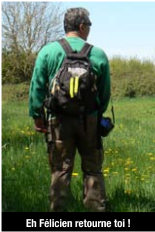
Eh Félicien retourne toi !