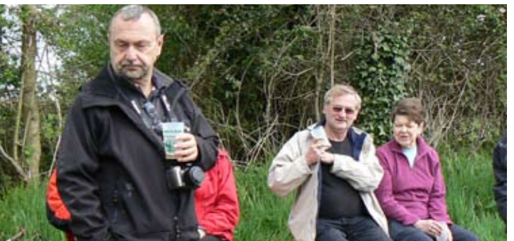
Qui boit dort et qui dort dîne. Une histoire à dormir debout !