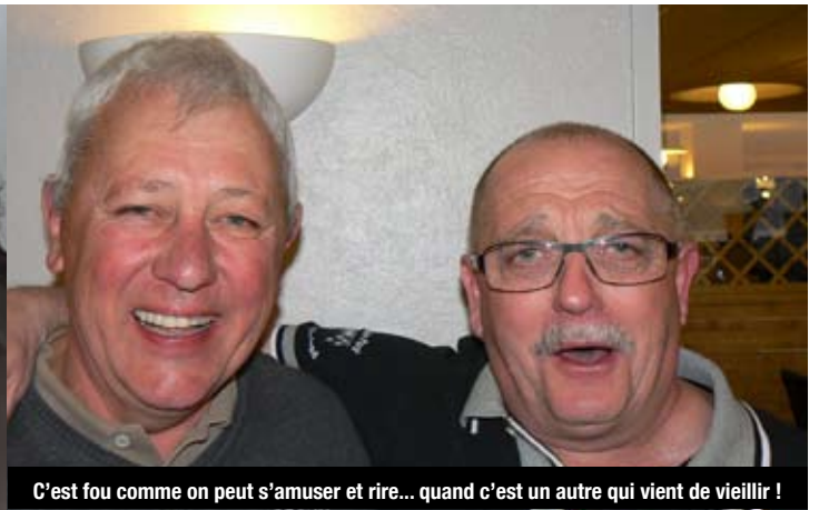
C'est fou comme on peut s'amuser et rire... quand c'est un autre qui vient de vieillir !