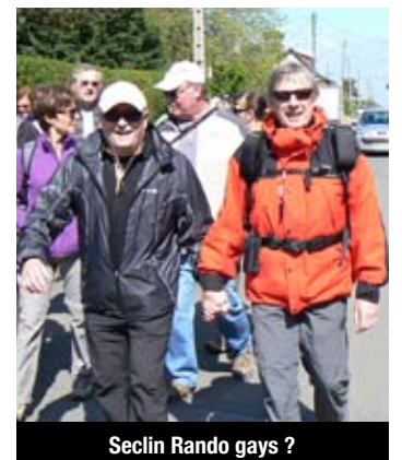
Seclin Rando gays ?