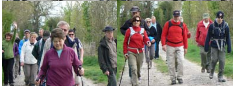
Marcher c'est bien et, en plus, c'est bien meilleur marché !