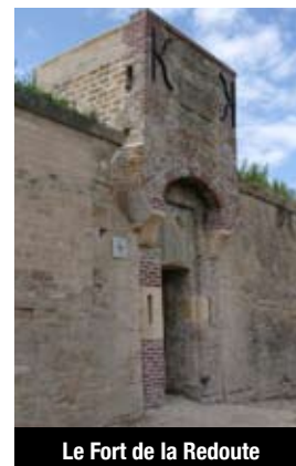
Le Fort de la Redoute