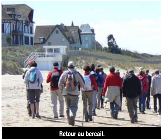
Retour au bercail.