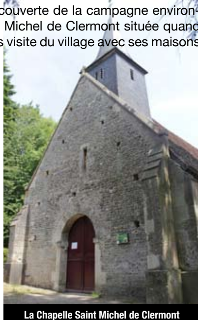
La Chapelle Saint Michel de Clermont